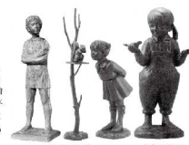
ふれあい 表正像の像 小鳥と少女 幸福への像

本館3階前庭に、少年少女にリスを抱いた「幸福の像」を一對と更に平和像面ターピンに、少女と小鳥を配した「平和の像」を寄贈建立します。このような福祉施設に人々の平和と幸福を象徴する像の寄贈を行う事は、誠に意義のある記念事業であると評価するものであります。