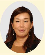
新居浜ライオンズクラブ会長