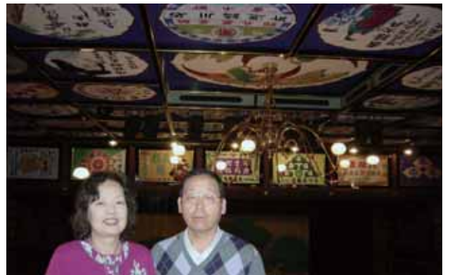
・大分県日田祇園山鉾会館にて・

私は一日のスタートは早く朝5時頃、場合によっては4時頃から仕事を始めますのでお昼頃は普通の人で言う夕方に相当し、体もかなり疲れてきております。その時に昼寝をすると、スカッとした気持ちで次ぎの